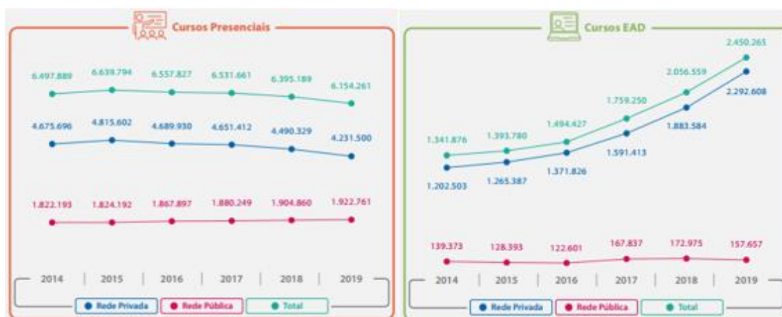
Figura 1 – Evolução das Matrículas no Período 2014-2019.

Já dados divulgados pela Associação Brasileira de Mantenedoras de Ensino Superior (ABMES) em maio de 2019, mostraram que o ritmo de crescimento da Educação à Distância no Brasil é maior do que o do ensino presencial. Em levantamento recente, elaborado pelo Instituto Semesp, vinculado ao Sindicato das Entidades Mantenedoras de Estabelecimentos de Ensino Superior no Estado de São Paulo (SEMESP), a conclusão é reiterada: em 2019, 28,5% das matrículas do ensino superior brasileiro estavam na modalidade EaD, enquanto em 2018 esse percentual era de apenas 24,3%. Na Figura 1 é possível observar a evolução das modalidades no período 2014-2019.